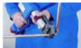
6.- Prensado 6.- Prensar