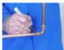
5.- Marcar la inserción 5.- Marcar a zona